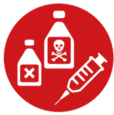
Giftige Stoffe und ansteckungsgefährliche Stoffe

dürfen sowohl im Handgepäck als auch im aufgegebenen Gepäck transportiert werden, wenn sie in einem elektronischen Gerät verbaut sind (z. B. in Laptops, Tablets, Kameras). Ersatzbatterien und -Akkus dürfen nur im Handgepäck transportiert werden. Powerbanks gelten als Ersatz. Auch E-Verdampfer dürfen nur im Handgepäck transportiert werden.