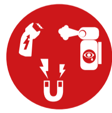
Verschiedene gefährliche Stoffe und Gegenstände