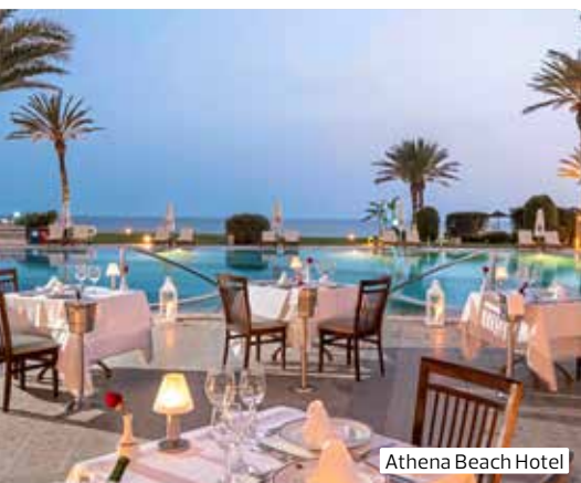
Athena Beach Hotel