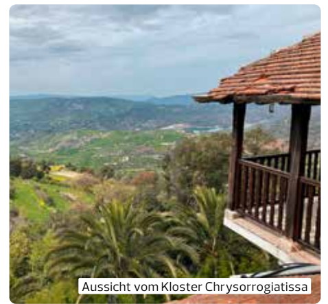
Aussicht vom Kloster Chrysorrogiatissa