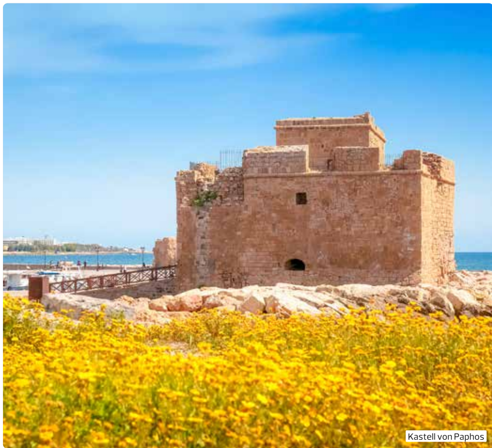
Kastell von Paphos