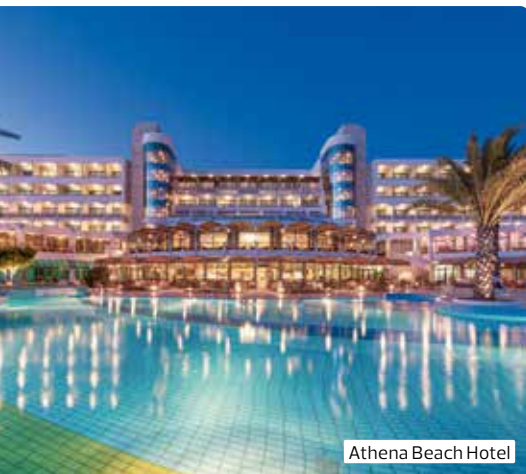
Athena Beach Hotel

Die Insel der Aphrodite ist ein Freilichtmuseum der Geschichte und ein Schatzhaus der Kunst: Faszinierende antike Stätten, wunderbar erhaltene byzantinische Fresken in Kirchen und Klöstern, Relikte aus der Zeit der Kreuzfahrer, der venezianischen, osmanischen und englischen Herrschaft. Alte Dörfer mit freundlichen, hilfsbereiten Menschen, eine schmackhafte Küche und ein guter Tropfen Zypernweines erfreuen den Gast.